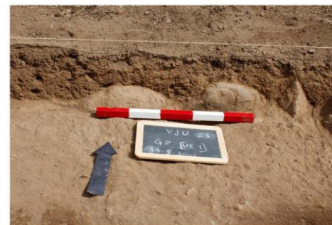
Aparecimento de estruturas enterradas

Uma nova campanha de escavações terá lugar entre outubro e novembro de 2023.