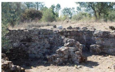
Balneário romano. Vista do caldarium