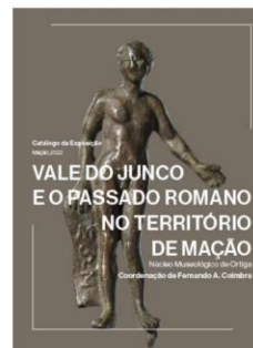
Capa do catálogo da exposição