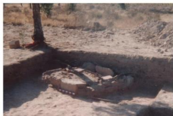
Base da forja de fundição. Escavação e foto de Rogério Carvalho

No início do século XX trabalhos agrícolas revelaram uma estatueta de bronze com uma inscrição em grego: ΣΩΝ