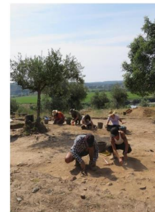
Escavação em curso