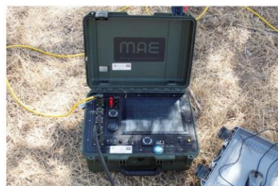
Aparelho utilizado na prospeção geoeletrica.

O projecto atual, aprovado pela DGPC, teve início em setembro de 2022, implementando tecnologias de prospeção não invasiva como a prospeção geoeletrica, identificando a possibilidade da existência de estruturas enterradas, confirmadas mais tarde na sequência de escavações arqueológicas. Em dezembro organizou-se uma exposição sobre o Período Romano em Mação, com destaque para Vale do Junco.