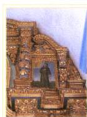
[Talha Dourada e Policromada]