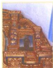
[Talha Dourada e Policromada]