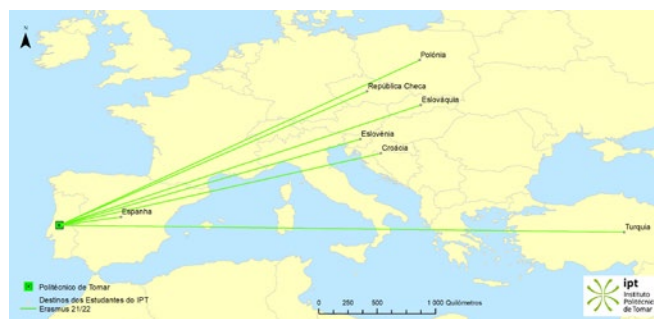
Mapa de estudantes outgoing