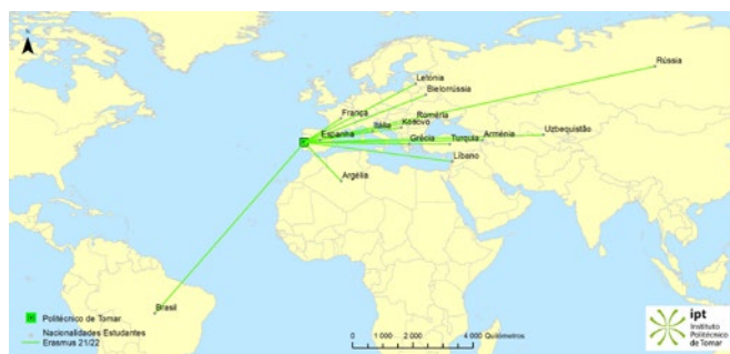
Mapa de estudantes incoming

Durante o ano académico de 2021-2022 estudantes do Politécnico de Tomar realizaram mobilidades Erasmus + na Polónia, Turquia, Espanha, Croácia, República Checa, Eslovénia, Eslováquia (ver mapas).